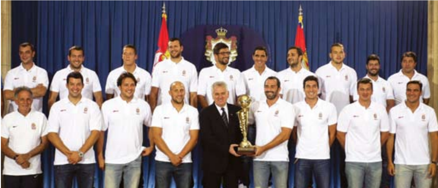
Председник Николић са изабраницима Дејана Савића, на свечаном пријему у Председништву Србије

П редседник Србије, Томислав Николић, примио је српске ватерполисте у згради Председништва Србије, по њиховом повратку у Београд из Мађарске, где су победили, у финалу Европског првенства у Будимпешти, селекцију домаћина.