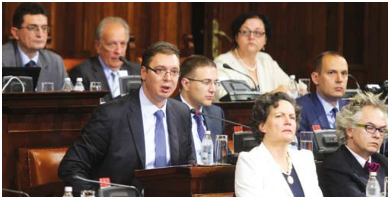
Премијер Вучић са министрима у Народној скупштини

„Имаћемо много изазова, проблема, недоумица, али ћемо, крајем 2016. и 2017. године, почети да спуштамо висину јавног дуга и почећемо боље да живимо. Предузимамо тешке мере и доносимо непопуларне законе да бисмо створили себи шансу, да бисмо направили бољи пословни амбијент и нормалну економију, да би људи могли да се запосле и да раде, и да бисмо сутра сви боље живели“, поручио је премијер Вучић.