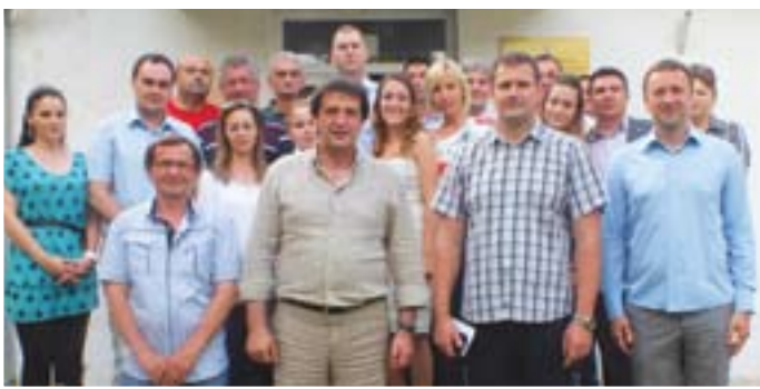
Министар Братислав Гашић у посети Опову