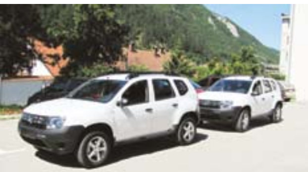
Теренска возила за помоћ старима у Прибоју и Пријепољу