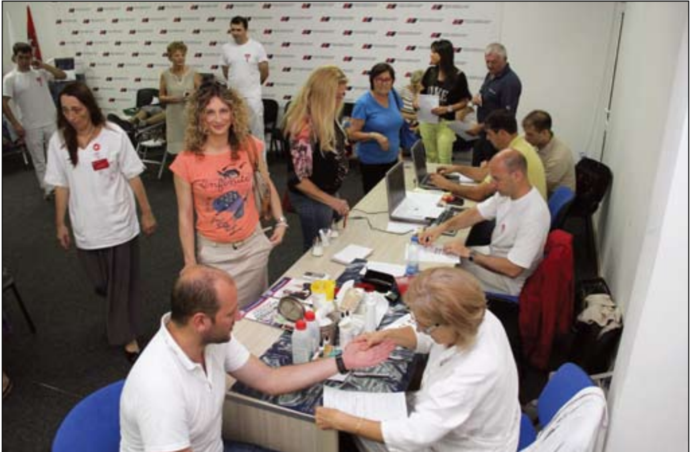
Велики број страначких активиста из Београда одазвао се позиву и добровољно дао крв у просторијама ГО СНС Београд