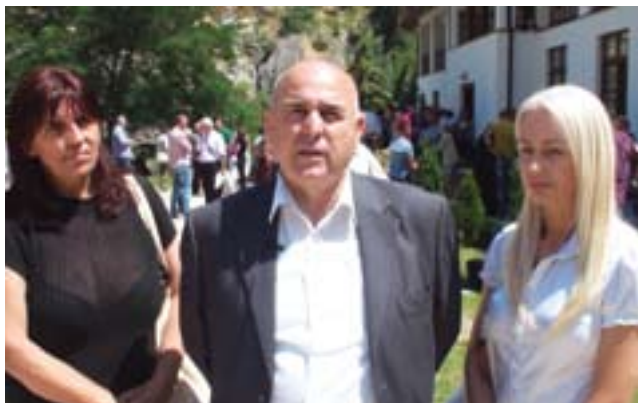
Напредњаци Краљева у посети манастиру Свети Архангели код Призрена