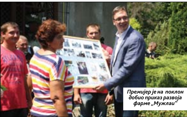
Премијер је на поклон добио приказ развоја фарме „Мужлаи“

„Иако имамо тешку годину, да тежу не можемо да имамо, због поплава, киша и невремена, у првих шест месеци, имамо раст извоза пољопривредних производа већи за 20 одсто и смањење увоза од седам одсто“, рекао је Вучић, истакавши да је поносан на резултате који се постижу у српској пољопривреди.