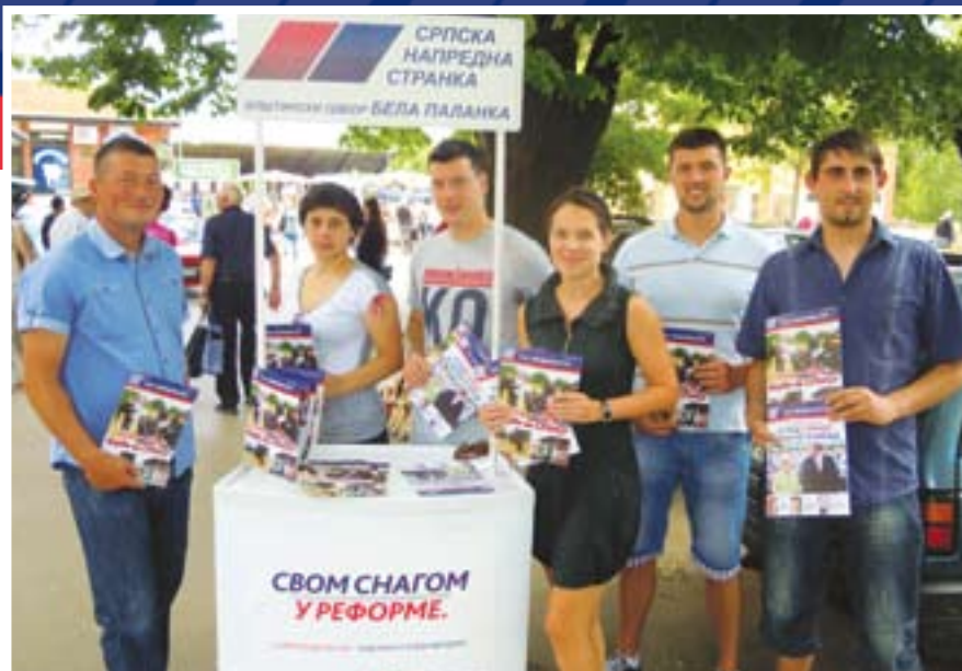
Млади напредњаци у Белој Паланци

У Црепаји је уређен парк, постављено је осветљење, избетонирана стаза и уређења зелена површина. Други пут, у току ове године, очишћена је депонија код Железничке станице. КУД „Свети Сава“ прославио је десет година постојања. Мото клуб „Спид хантерс“ организовао је скуп, на коме су се окупили гости из земље и иностранства. Постављене су уградне кутије које регулишу паљење и гашење уличног