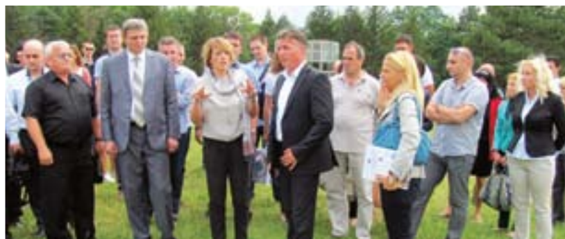
Министарка Јадранка Јоксимовић у посети нишкој Општини Палилула