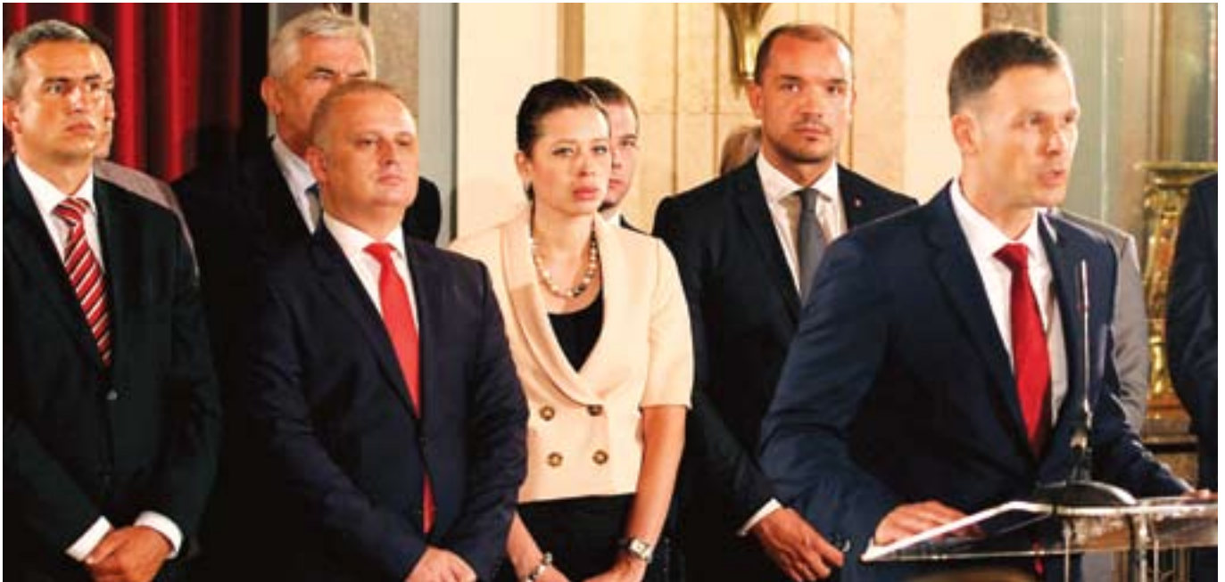
Градоначелник Београда, Синиша Мали, са сарадницима, током представљања резултата сто дана рада

Градоначелник Београда, Синиша Мали, после 100 дана рада градске власти, каже да је најважнији потез који је повучен управо то што је заустављено даље задуживање града и што је тако спречен банкрот, до кога би дошло због неодговорне политике претходне власти.