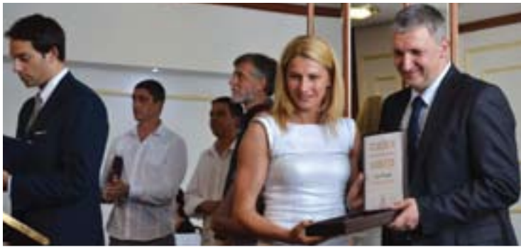
Додела плакета у Аранђеловцу