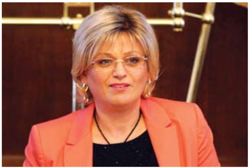
ЈОРГОВАНКА ТАБАКОВИЋ, гувернер НБС