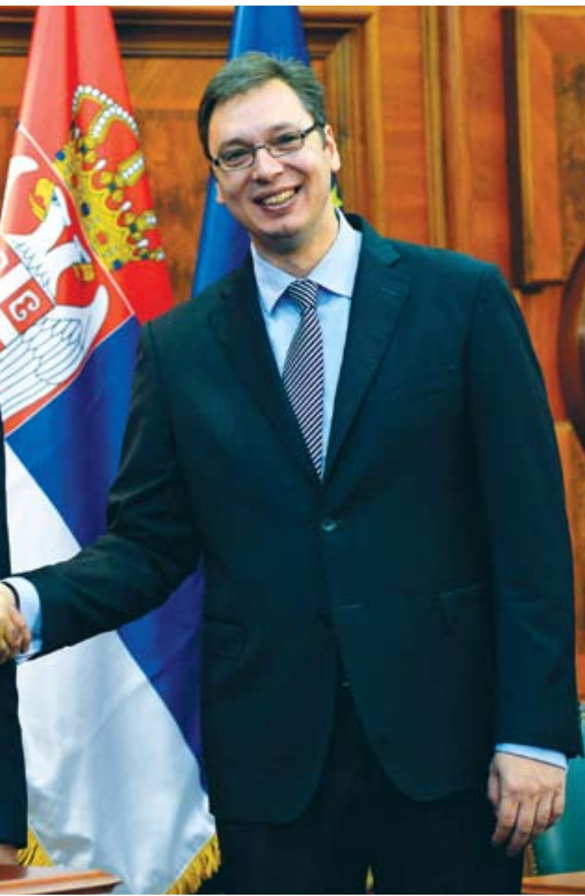
Срдчан сусрет: Сергеј Лавров и Александар Вучић