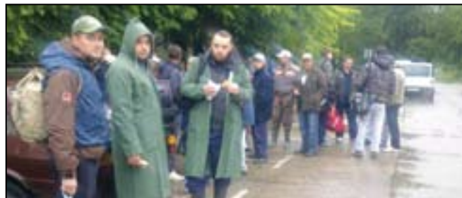
Добровољци из Ковачице