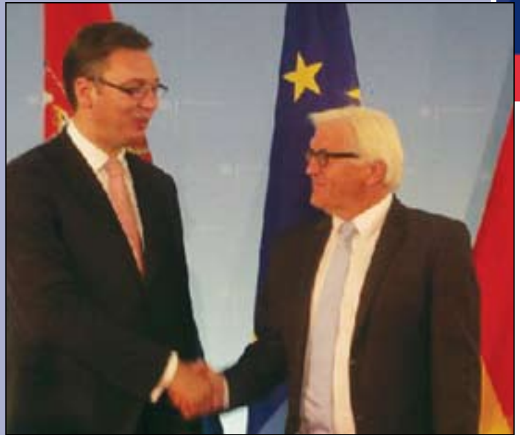
Александар Вучић и Франк Валтер Штајнмајер, министар спољних послова Немачке

Премијер Вучић се захвалио на подршци и помоћи коју је немачка влада упутила Србији током поплава, нагласио да регион карактерише политичка стабилност и да нема проблема у сарадњи између суседних земаља. Министар Штајнмајер је истакао да поштује важне и храбре кораке које је предузео председник српске Владе, када је у питању однос са Приштином, и нагласио да је то довело до стабилности у региону.