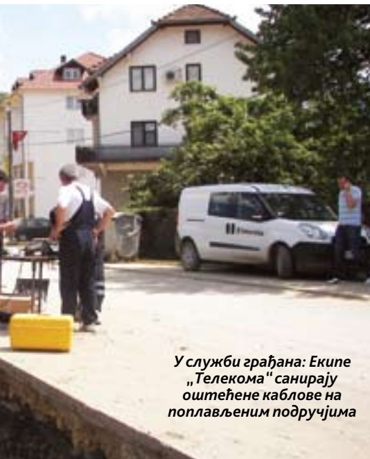
У служби грађана: Екипе „Телекома“ санирају оштећене каблове на поплављеним подручјима