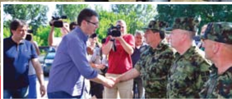
Премијер Републике Србије, Александар Вучић, обишао је поплављена подручја и разговарао са грађанима Обреновца и Крупња