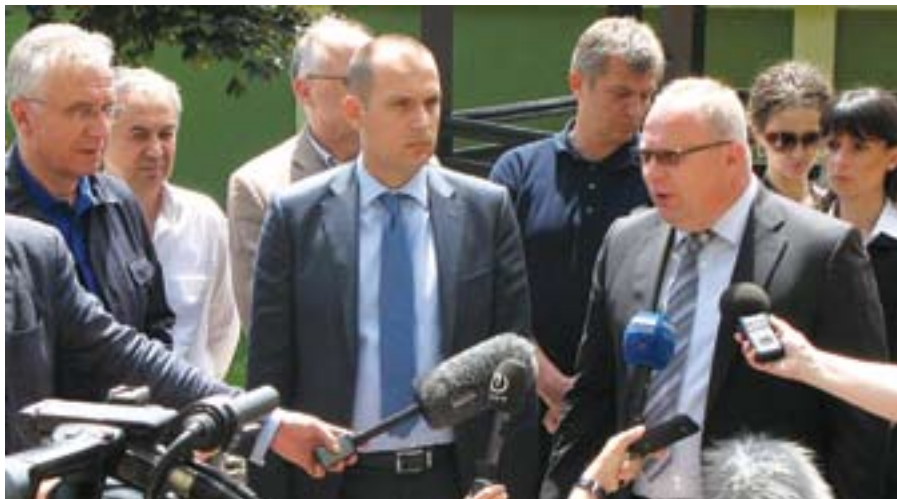
Састанак министара здравља Србије, Хрватске и Републике Српске у Шиду

У Јамену је стигла донација бугарске фирме од 25 тона хране за стоку и живину. Из Аустрије је стигла помоћ од неколико хуманитарних организација, а координатор акције било је Човекољубље, која делује у оквиру СПЦ. Градоначелник Новог Сада, Милош Вучевић, посетио је Јамену и донео конвој хуманитарне помоћи. Министри здравља Хрватске, Србије и Републике Српске, Рајко Остојић, Златибор Лончар и Драган Богданић, посетили су Моравић како би се на лицу места уверили у стање