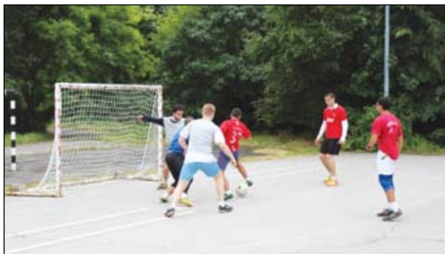
Турнир у Кошутњаку