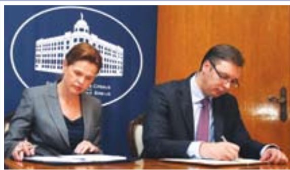
Потписивање Писма о намерама са премијерком Словеније, Аленком Братушек

„Циљ Србије је да постане чланица ЕУ, али истовремено и да очува добре односе са Русијом“, истакао је Вучић, током разговора са Лавровим.